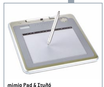
mimio Pad & Στυλό